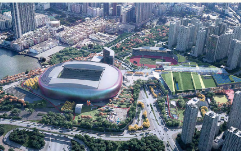
啟德體育園

香港8、90年代的流行文化對內地及東南亞人民有很大的影響（吳子倫，2024），因此演唱會經濟亦值得特區政府重點考慮。演唱會經濟近年來高速擴張，2023年僅內地演出市場總體經濟規模就已達739.94億元人民幣（約1,085億港元）（人民日報，2024年4月8日）；而香港各大表演場館近一年來租場率將近100%，檔期難求、仍屬區內優先選址。香港流行文化自上世紀末期起風靡一時，以港式文化為底蘊的各種文化藝術作品早已深入人心，不僅為內地的文化產業發展帶去了深遠的影響，一眾港星的知名度也傳揚海外，成為典型的香港招牌。文化及創意產業自2009年起更被列為本港六大優勢產業之一（政府統計處，2011年2月23日）；2022年，香港的文化及創意產業佔本地生產總值的4.5%，從業者佔總就業人數6.1%，增加價值達到1,221億港元（政府統計處，2024年6月17日），是支持香港推動高增值經濟發展的重要動力。不少知名歌手亦青睞於打開香港巡演市場。有統計指，自疫情復常後，每月均有至少2位歌