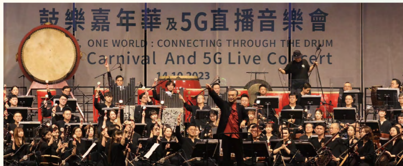
香港中樂團《鼓樂節》