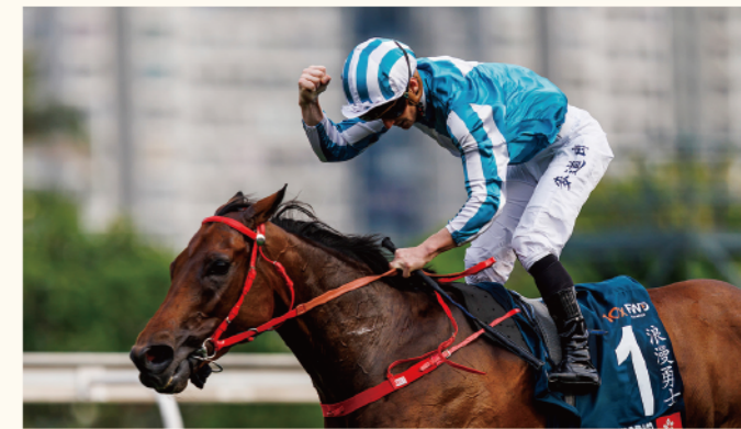
（圖片來源@香港賽馬會）

香港在落實《全國馬產業發展規劃（2020—2025）》方面，尤其是在馬術運動產業和馬文化方面有先機優勢。馬術相關盛事相信可為香港帶來輻射式經濟效應，當局應加以配合，將馬術盛事與本港社會經濟和各產業結合，例如推出觀賽及住宿套票、觀光行程等等，以馬文化的產業鏈帶動更多高增值經濟消費。