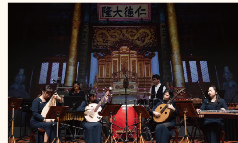
香港故宮演藝嘉年華

特區政府亦應善用香港金融中心的優勢，拓寬融資渠道。香港交易所於2023年3月推出了「新特專科技公司」上市機制，讓五類尚未盈利的特專科技公司，包括1）新一代信息技術、2）先進硬件及軟件、3）先進材料、4）新能源及節能環保，以及5）新食品及農業技術的企業，在GEM板上市融資。在西方國家，不少足球俱樂部（如熱刺、曼聯）是上市公司，而內地的在線音頻平台喜馬拉雅控股亦正在香港申請上市。特區政府應考慮將五類尚未盈利的特專科技公司加上文化體育類的產業，支持更多具有打造盛事品牌的文體企業做好融資工作，讓香港在購買海外的盛事活動主辦權以外，逐步打造更多有世界影響力的盛事知識產權（IP），建立起更多知名的自有IP，輸出全球。