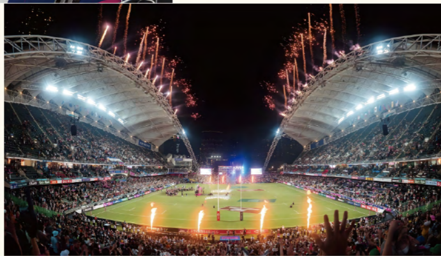
國際七人欖球賽